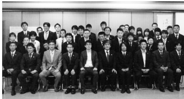
グループワーク中心の内容の濃いセミナーでした

後、事例をもとに各グループで経営戦略を考え発表していきました。活発な意見交換により様々な考え方ができ、なかでも、萩YEGならではの個性的な戦略が発表されるなど、非常に内容の濃いセミナーとなりました。