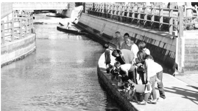
稚魚放流中。大きくなって帰って来いよ！