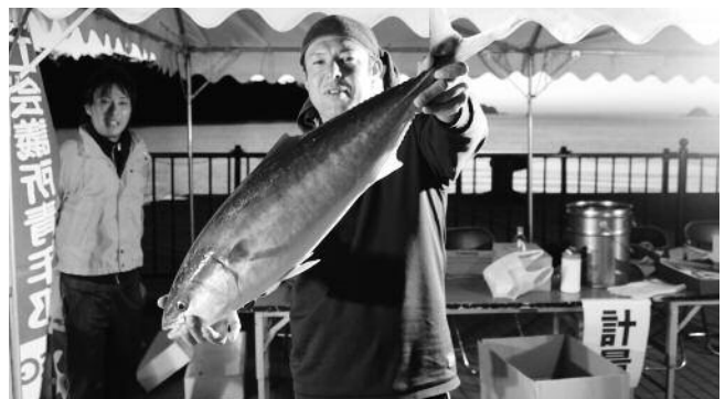
青物ダービー優勝者

けではなく、様々なイベントが行われ、海上保安庁巡視艇体験乗船や、萩の魚を紹介する「おさかな紹介」があり、その後ブリとヒラマサを解体するショーが行われ、解体した魚は無料で来場者に振る舞われ大変喜ばれていました。