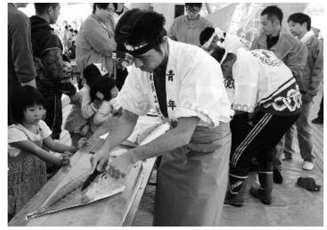
青年部職人のさばき!!