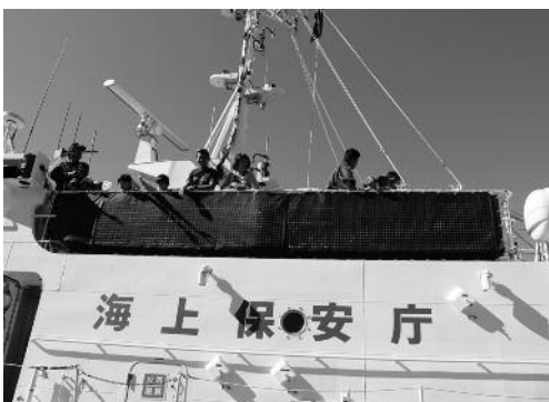
海上保安庁様、ご協力ありがとうございました