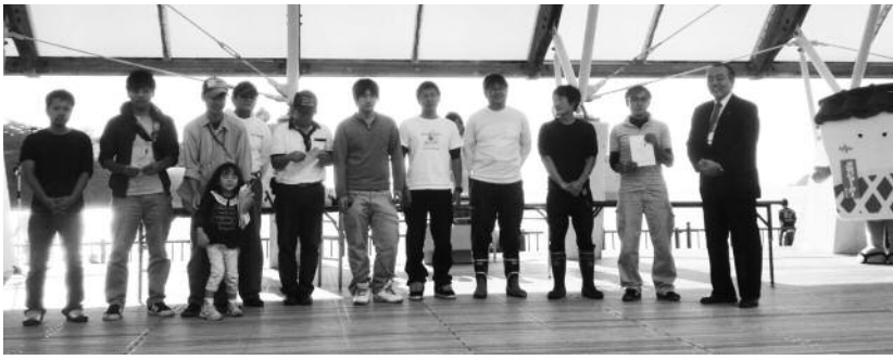
ファミリー部門入賞者!!