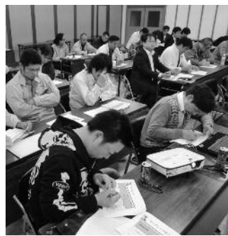
1分間で強みを語る。そしてそれに聞きいるメンバー

記念講演は、映画監督・脚本家の「錦織良成」氏による「ローカルこそ最先端」というテーマの講演で、安来市と同じく山陰側に位置している萩の我々に