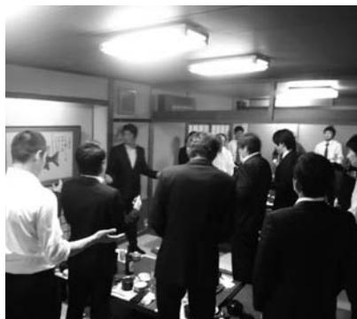
熱く語った懇親会

5月13日(水)、会頭・副会頭との意見交流会が開催されました。まず最初に青年部、親会、共に今年度の事業説明を行い、青年部事業について、親会より貴重な意見を頂くことができました。親会の事業については、会頭の萩市に対する熱い思いと、商工業者や地域の皆様の明るい暮らしの為の事業の説明を受け、大変勉強になりました。