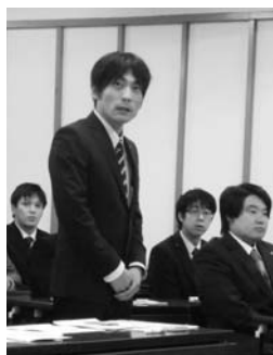
会長による事業説明