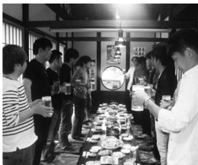
皆さんお疲れ様でした