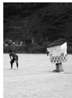
ぶちジョーカーも大活躍！