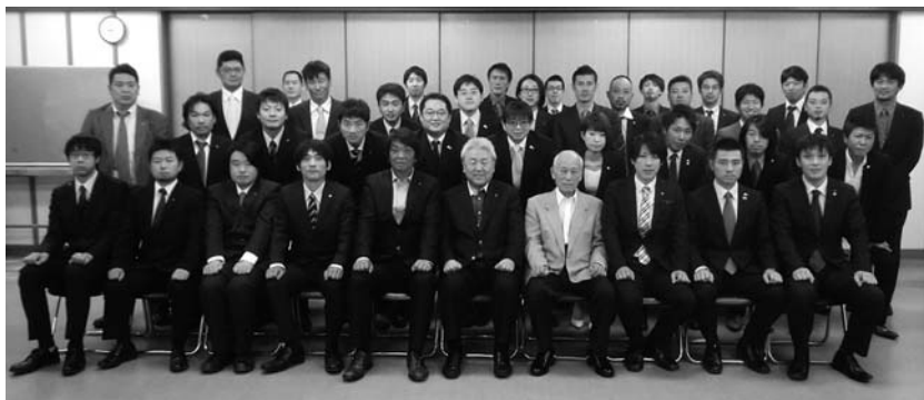
たくさんの会員が参加しました