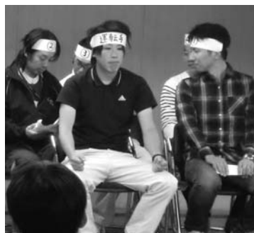
委員会メンバーによる実演